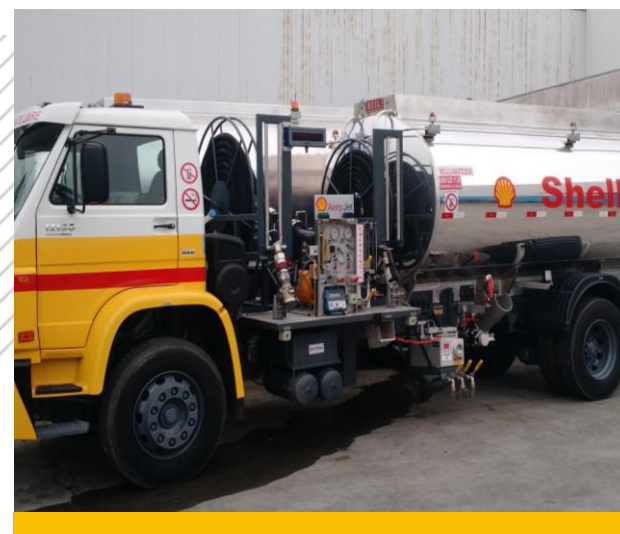
CTA para abastecimento de combustível Aviação