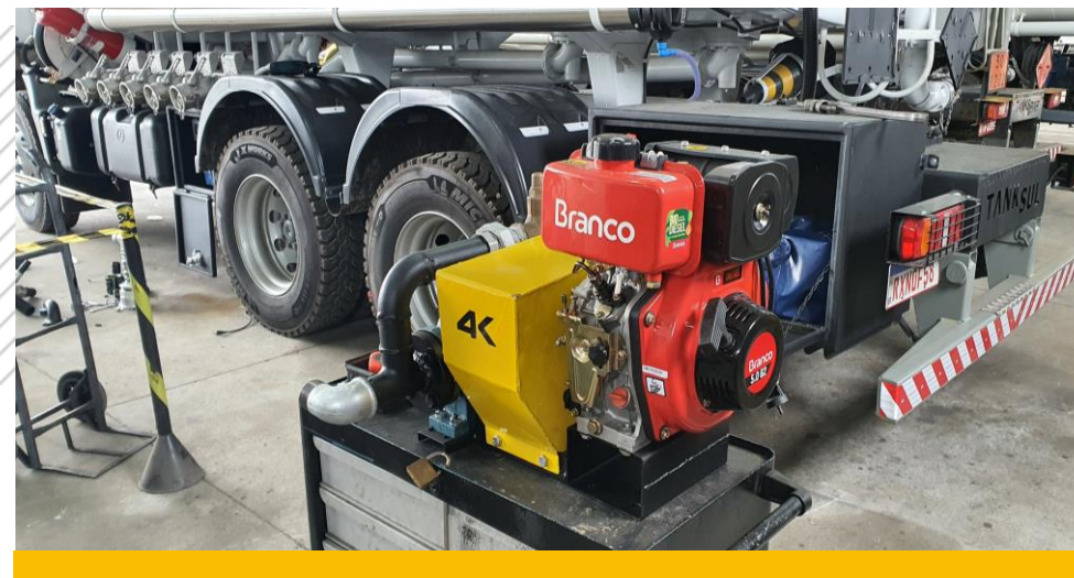
Skid para transferência de fluídos