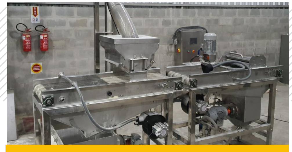
Máquinas para a indústria alimentícia