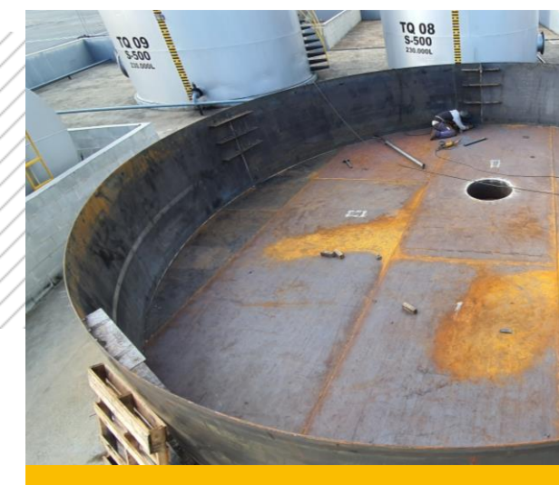
Fundo Tanque 700m 3 para combustível