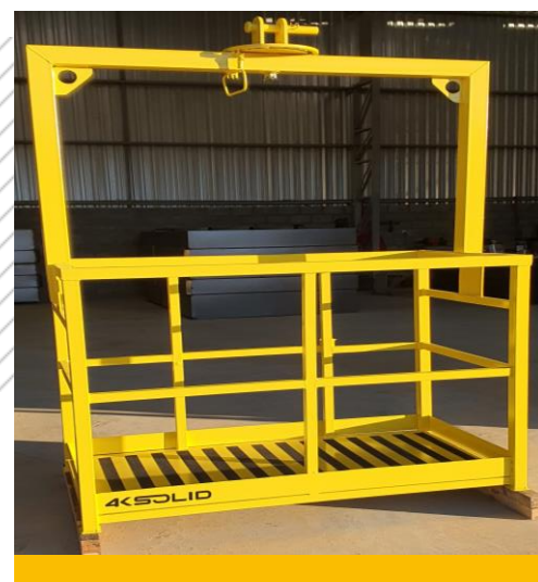
Cesto de elevação - Munck