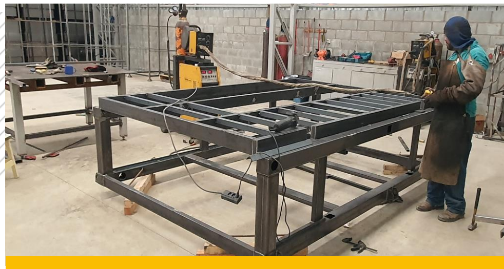
Estrutura para máquinas