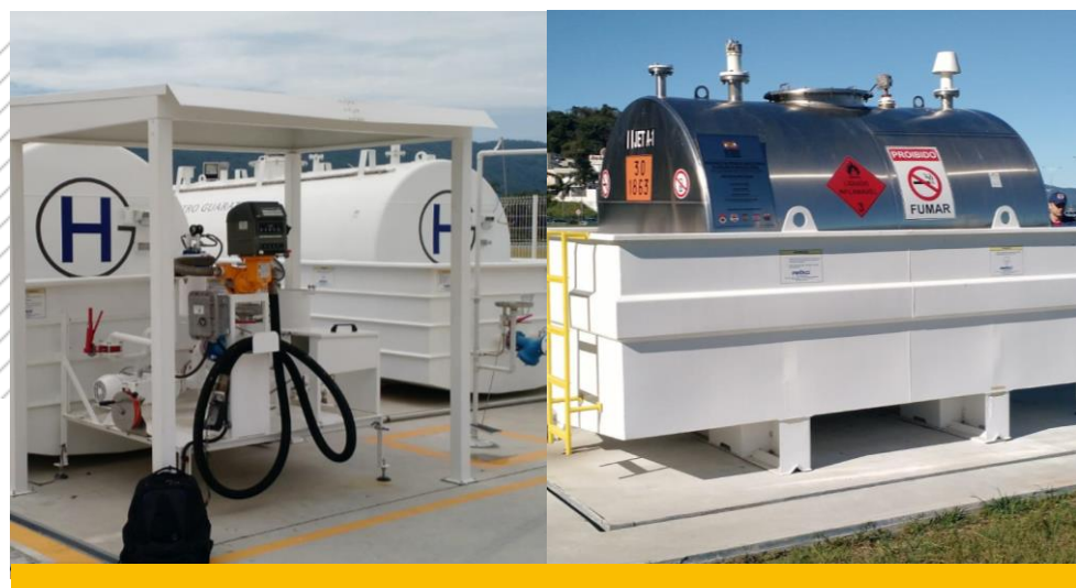
Módulo estacionário para abastecimento de aeronaves