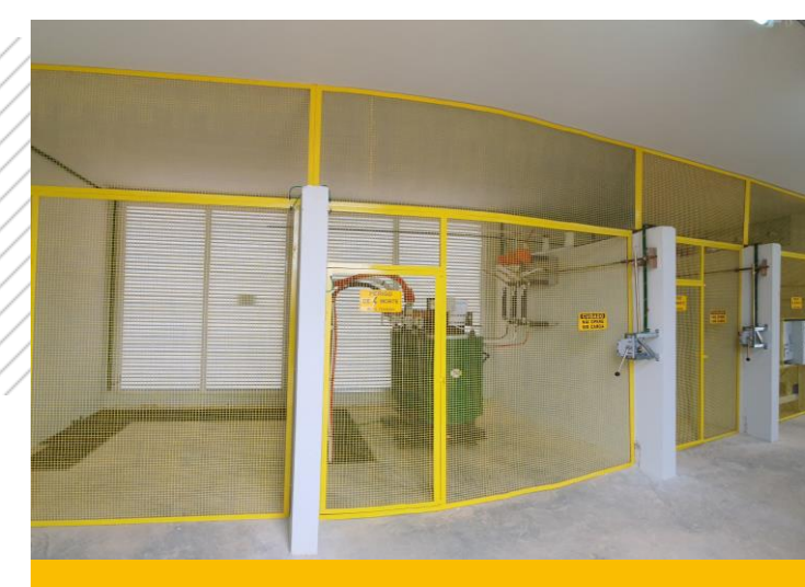
Grade Subestação - Celesc