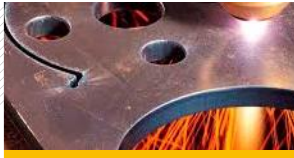
Corte a Plasma